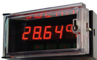
ALMEMO® MA 4490-2 mit Plastikabdeckung (type 4100-A)